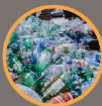
Bottiglie di plastica