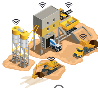
IMPIANTO E FLOTTA